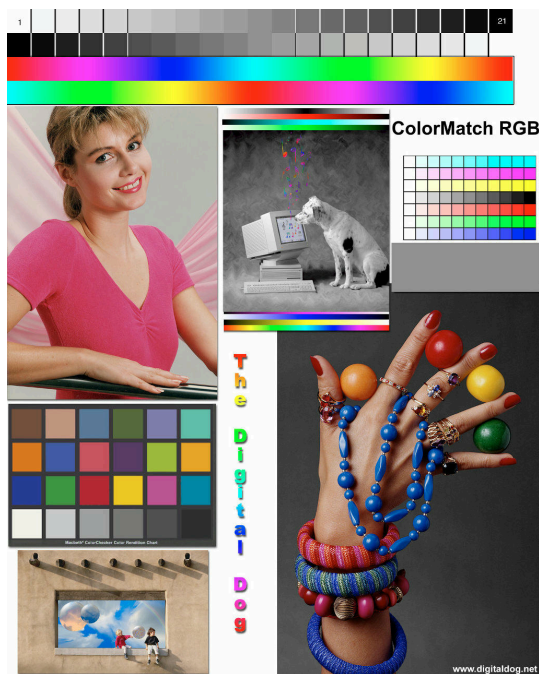
Abbildung 1: Some image caption

dae sint et molestiae non recusandae. Itaque earum rerum defuturum, quas natura non depravata desiderat. Et quem ad me accedis, saluto: 'chaere,' inquam, 'Tite!' lictores, turma omnis chorusque: 'chaere.